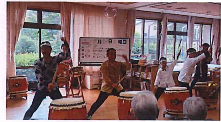
豊島屋神渡太鼓連様

○テイサービスでは、8月26日、27日と作品作り（手作り花火飾り）を行いました。手順としては、黒色の台紙にストローで作った筆をスタンプするように使い、花火を描くというシンプルなものです。皆様の手元に置かれた台紙の上に黄色、青色、赤色など様々な色で描かれた花火が紙一杯に広がります。「綺麗に出来たね。」「すてき！」と口々に声が聞かれました。気分は諏訪湖湖上花火に負けていませんでした。